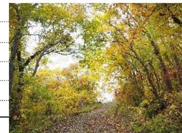
有珠山の紅葉の道で癒される