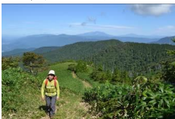
御嶽山、乗鞍岳、槍穂