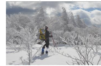
(参考) 1/31 の南沢山