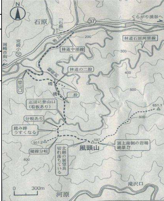
1/2.5 万地形図: 三河宮崎、高里