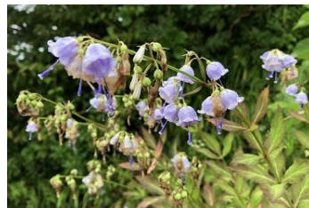
ツリガネニンジン