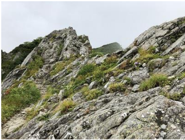
↑最難関の御秘所の岩稜