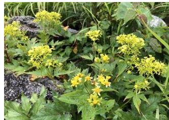
アキノキリンソウ&キンレイカ