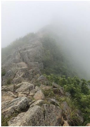
↑三国岳手前の剣ヶ峰付近