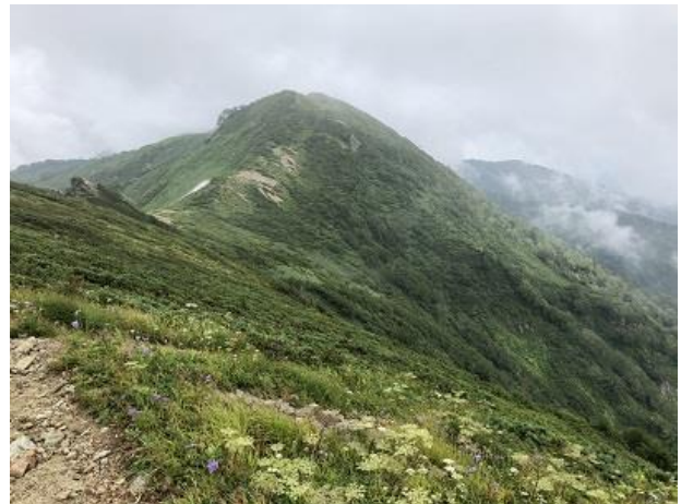
↑御前坂付近から本山小屋方向を望む