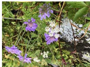
マツムシソウ&ヤマゼリ