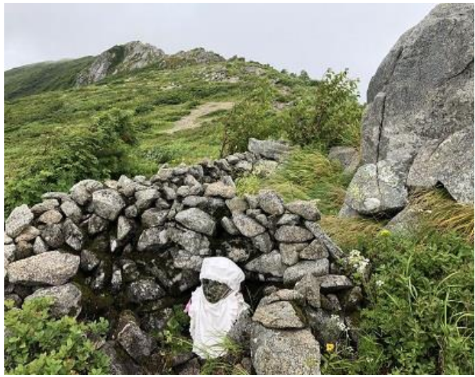
↑姥権現から飯豊山方向を望む（飯豊山は見えません）