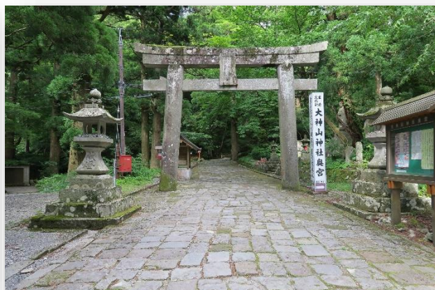
大神山神社奥宮へ続く参道