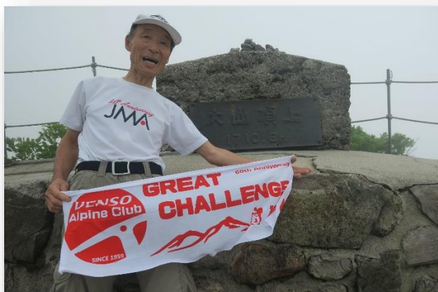
弥山山頂でガスと風の合間を見つけて撮影

直前までガスっていた天候がわずかにガスが抜け、シャッターチャンスをもらって何とか撮影ができて一安心。下降路は 6 合目のすぐ下の分岐を右に曲り元谷へ、そして大神山神社を經由して大山寺の集落へ(登山口)戻ることができました。