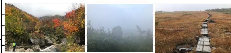
登山口付近の紅葉 玉子石 山頂付近の長い木道

〈山行報告〉 湖山荘のマイクロバスで4:00に出発する。10名乗車。外は真っ暗で小雨の降る中、中の岐(また)林道を登山口へ向かう。途中 舗装道路からダートになる。悪路を揺られながら1時間15分で登山口に着く。雨は上がった。登山準備を済ませラジオ体操後ヘッドライトを点け5:35出発する。(12:30までに下山できるように行動。行動時間:約7時間) 玉子石分岐までは急登が続く。2時間で分岐に着く。休憩後、玉子石に行く。玉子石からの展望(巻機山、八海山、越後駒ヶ岳、荒沢岳、守門岳)を期待したがガスで見えない。記念写真を撮り、平ヶ岳へ向かう。平坦な長い木道を歩く。気持ちが良い。晴れていたなら絶景ポイントだ。平ヶ岳山頂に8:50到着。山頂からは至仏山、武尊山、富士山が見えると案内があったが見ることができなかった。下山は姫池経由の周回コースを歩く。こちらも長い木道が整備されていた。玉子石分岐から登山口まで約2時間で下る。途中寄り道をし、登山口手前10分程の洞窟の中の「ヒカリゴケ」を見に行った。(登山道から脇道を5分程歩く)バス停の靴洗い場で靴を洗いバスに乗り込む。全員の下山が早く13:00の出発を待たず帰路についた。