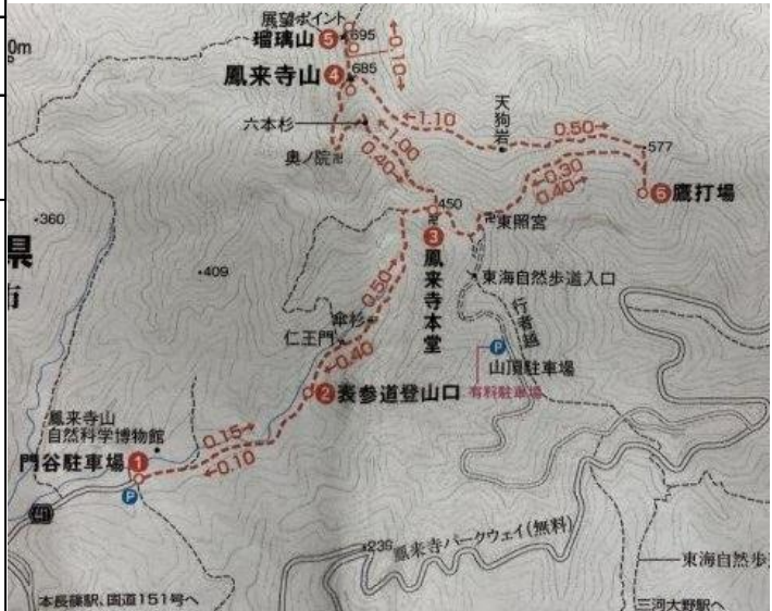
1/2.5 万地形図: 三河大野

11/07 曇り時々晴れ 07:00 刈谷発 08:48 門屋駐車場 発 09:04 登山口 09:36 休憩 09:45 鳳来寺「本堂」 (パークウェイ組と合流) 10:50 奥の院跡 11:13 鳳来寺山・山頂 11:25 瑠璃山・展望地 11:43 鳳来寺山・山頂 12:14 天狗岩 12:44 分岐 12:47 鷹打場 13:45 東照宮 13:50 鳳来寺「本堂」 14:25 仁王門 14:40 門屋駐車場 着