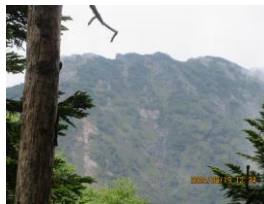
木々の間から赤岳頂上

赤岳への登頂ルートは色々あるが、登山者が少なく静かな山歩きが出来る県界尾根を登り～真教寺尾根を下るルートを選んだ。山岳部現役の頃、両尾根を2月の冬山に登った事を思い出しながら登った。当初は日帰り往復も考えたが、県界尾根、真教寺尾根ともに上部の岩場に鎖場や鉄ハシゴが連続して現れるので無理せず、赤岳山荘に宿泊してのんびりと時間をかけて登ることにした。赤岳山荘は初めて泊まったが食堂からは甲武信岳など奥秩父山塊を展望出来るように作られている。平日で空いていたのでゆったりと過ごすことが出来た。赤岳頂上では現役部員が企画している300名山登頂の記念写真を撮った。今回の核心部の上部の岩場の難所は県界尾根の方が急峻で距離も長いかなと地図読みしたが、真教寺尾根も下ってみると県界尾根と同程度の難易度かなと思った。インターネットで両尾根の山行記録などを調べてみてもあまり変わらない。