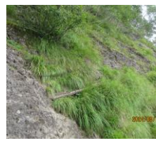
県界尾根上部岩場