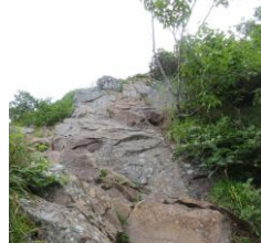
真教寺尾根の鎖場