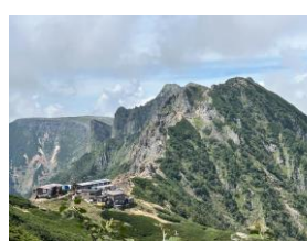
横岳と赤岳展望荘