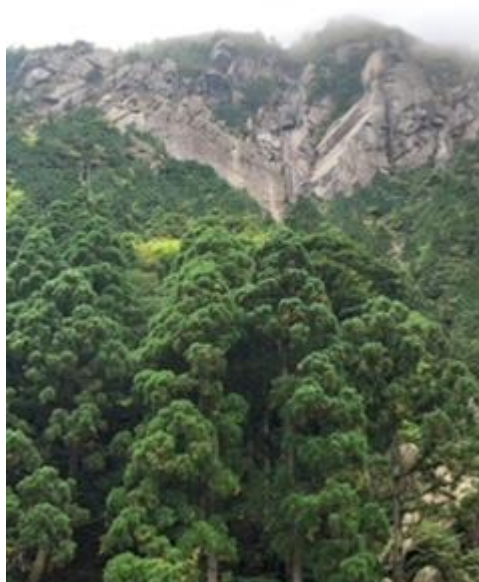
藤内壁を見上げる