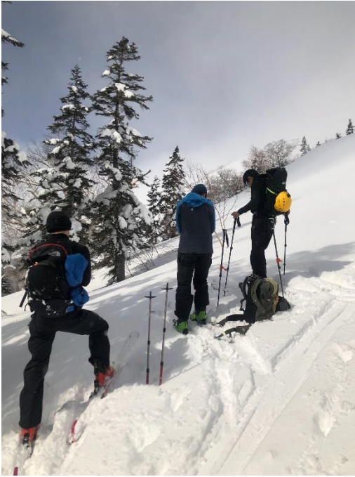
うさぎさん隊の出発