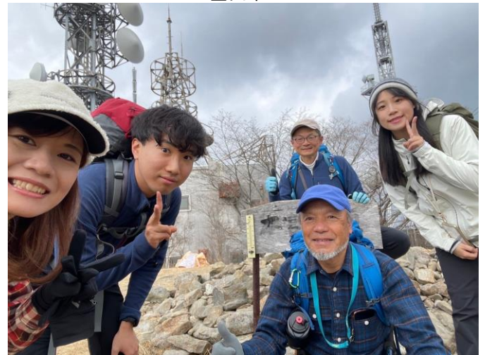
頂上で撮影した集合写真