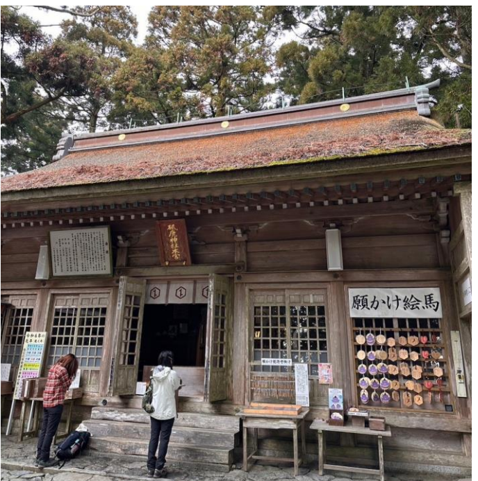
砥鹿神社奥宮にて参拝