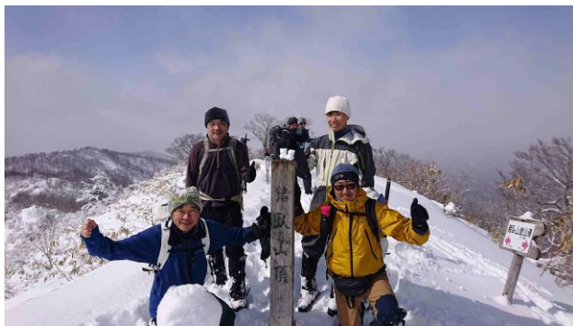
おまけ インスタグラマーの裏に写っている我々 リンク先