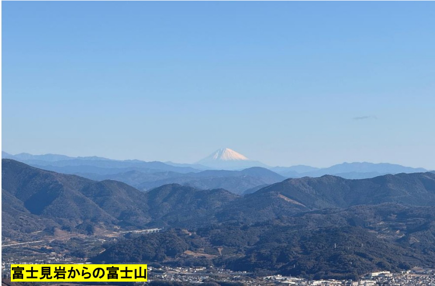
富士見岩からの富士山