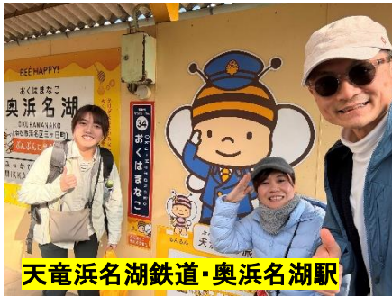
天竜浜名湖鉄道・奥浜名湖