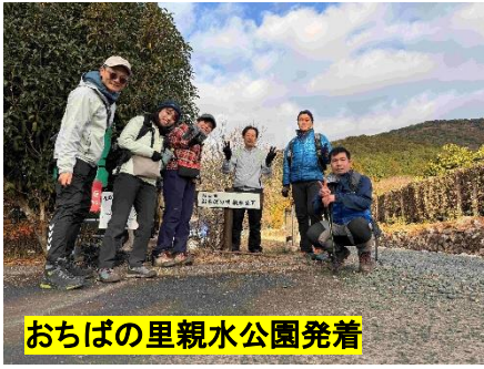
おちばの里親水公園発着