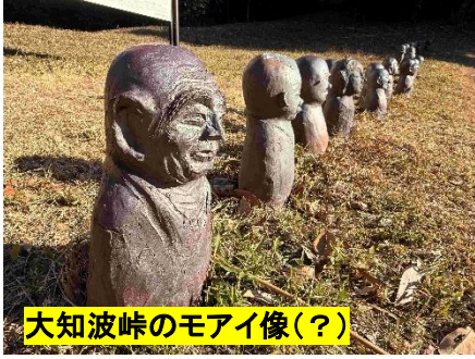
大知波峠のモアイ像(?)