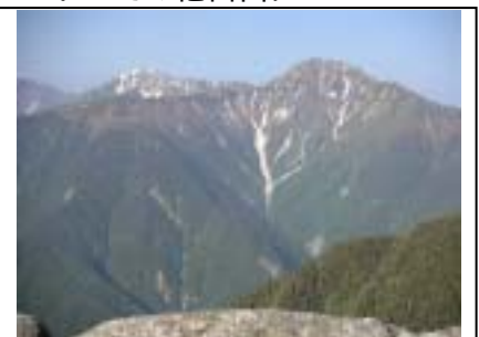
観音岳から見た北岳