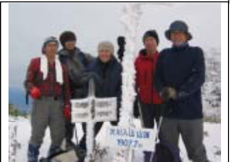
とにかく寒い一日でした。

その後、装備を解き、治部坂スキー場横の温泉(とまり木の湯)につかり、冷え切った体を解凍し、一息ついた。(16:45-17:50)その後、R153を順調に戻り、刈谷20:00解散。今回の山行では、雪のため全体的に時間をおした内容となった。私自身雪山初登頂という事もあり、経験・体力不足を痛感した。CL、SLの方々に、この場を借りてお礼申し上げます。