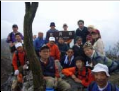
天狗岩で記念写真

リーダー所見 OBも含め、総勢19名のにぎやかな山行で、皆さんに早春の山を楽しんでいただき、良かったと思います。当初、心配した積雪も直前に暖かい日が続いたため、8合目から左側にトレースがあった冬道を使用することなく、夏道をそのまま登ることができました。今後も、このような企画を継続していきたいです。