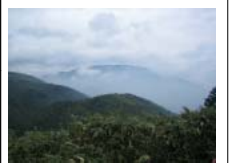
横川山より富士見台、恵那山方面