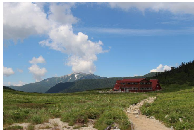
黒部五郎キャンプ場