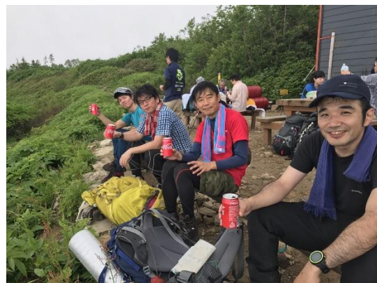
全員 コカ・コーラ(笑)