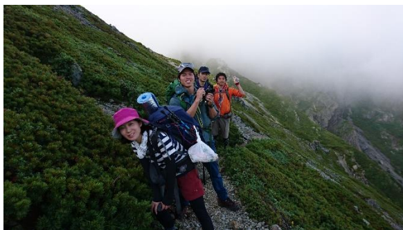
お天気回復 稜線歩き2