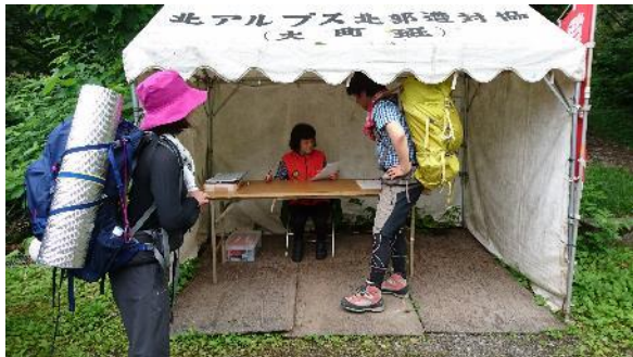
この受付嬢がやばい...