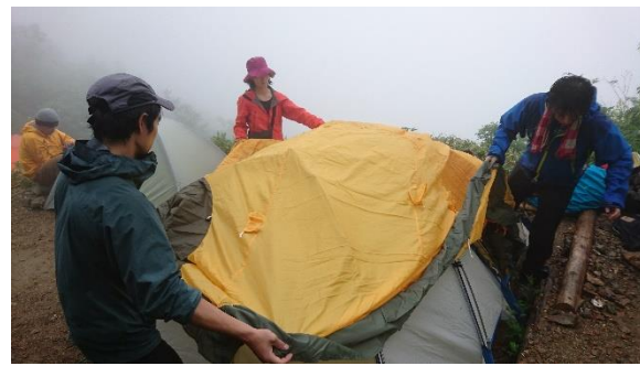
テント張り 問題発生???