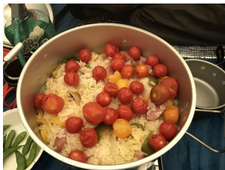
鍋のパエリア 味はサイコー♪