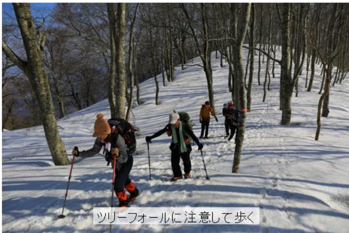
ツリーフォールに注意して歩く