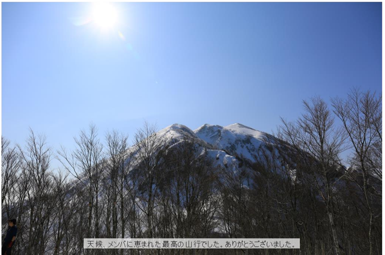
天候、メンバに恵まれた最高の山行でした。ありがとうございました。