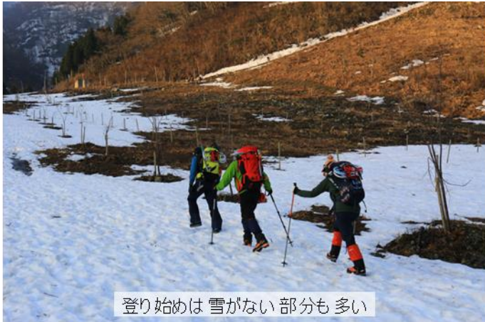
登り始めは雪がない部分も多い