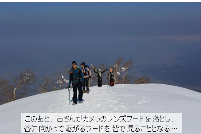
このあと、古さんがカメラのレンズフードを落とし、 谷に向かって転がるフードを皆で見ることとなる…