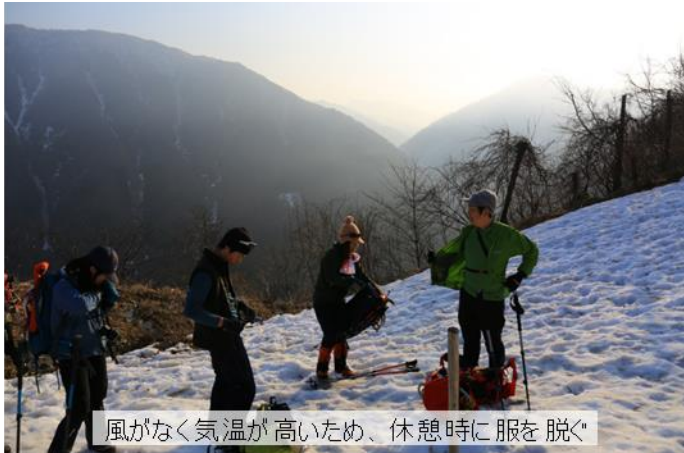
風がなく気温が高いため、休憩時に服を脱ぐ