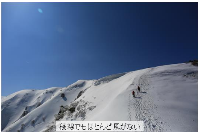
稜線でもほとんど風がない