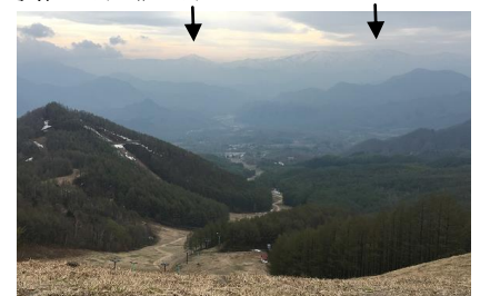
七ヶ岳(スキー場上部)から見る 燧ヶ岳(左↓)、会津駒ヶ岳(右↓)

【七ヶ岳】地形図を見るとミニ戸隠山である。本来はその稜線を歩くべきだろうが、残雪期は歩きにくいように他のコースは入山禁止となっていた。スキー場を歩き、スキー場上部のピークから20分で頂上である。その20分間に残雪歩きをする。スキー場を登るときにジムニーの3人組とすれ違ったが、残雪の足跡は不明だった。残雪の山に一人で登る時は要注意だ。