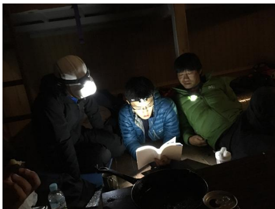
翌日に向けルートを確認する