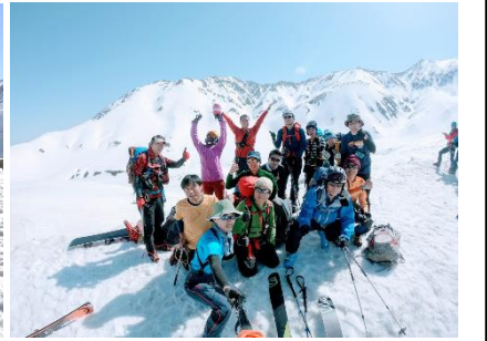
雷鳥荘前にて集合写真(14名)