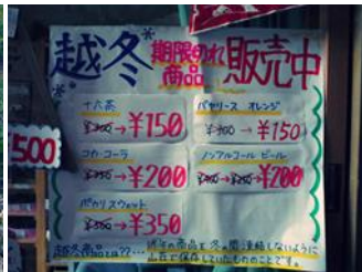
冷池山荘の越冬商品