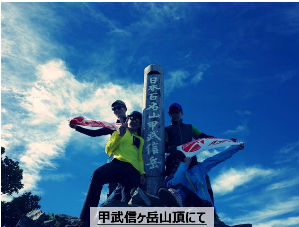
甲武信ヶ岳山頂にて