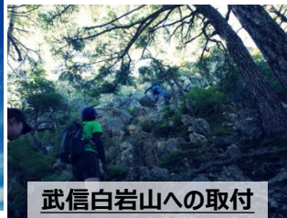
武信白岩山への取付