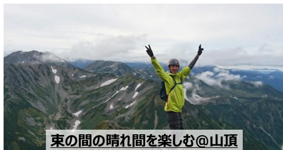
束の間の晴れ間を楽しむ@山頂