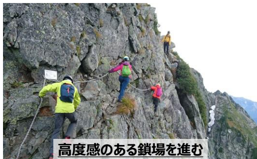
高度感のある鎖場を進む