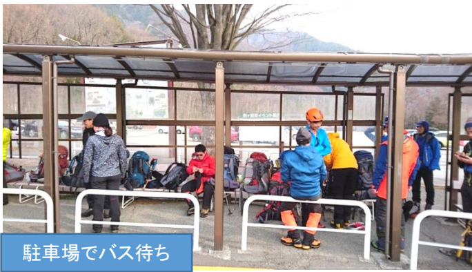
駐車場でバス待ち