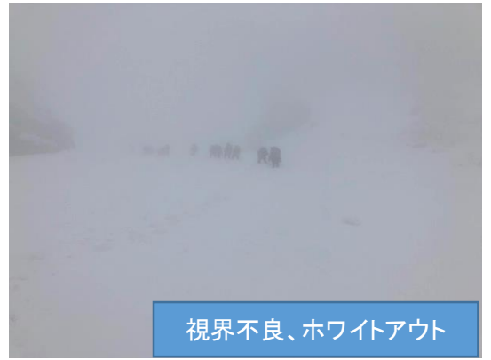
視界不良、ホワイトアウト