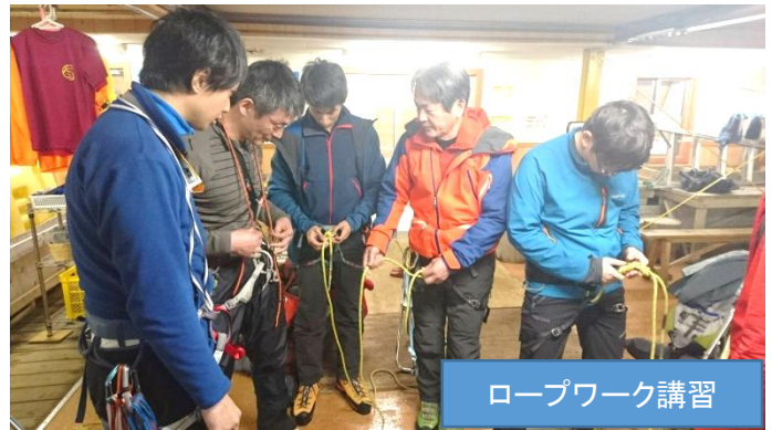
ロープワーク講習