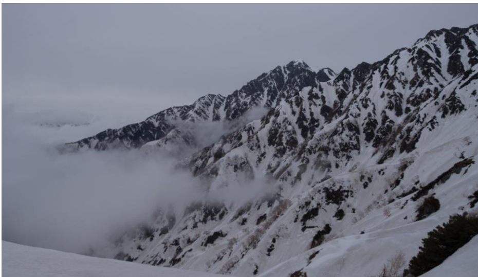
二日目：室堂乗越より劔岳