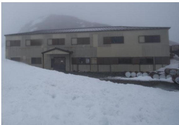
二日目：剣御前小屋(雨)