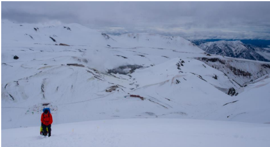
初日：別山尾根7合目より