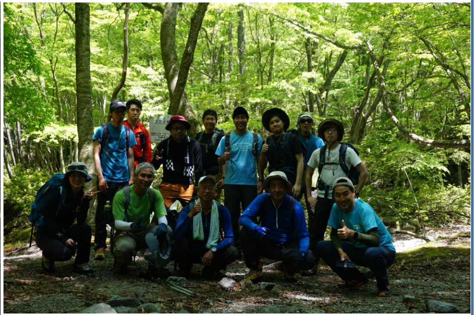
コクイ谷出合で雨乞班と御在所班に別れる