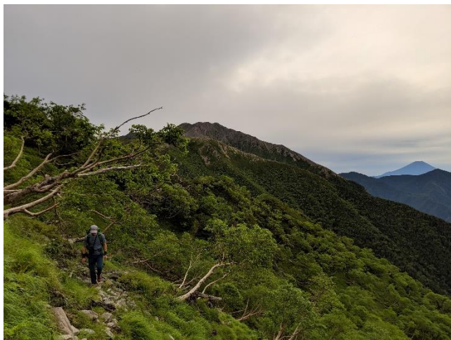
百間洞からのトラバース路。富士山。