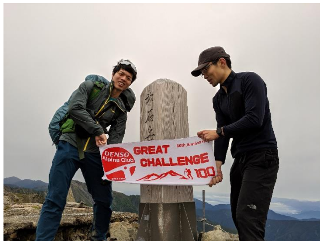
赤石岳。疲れすぎて向きが分からなくなった。