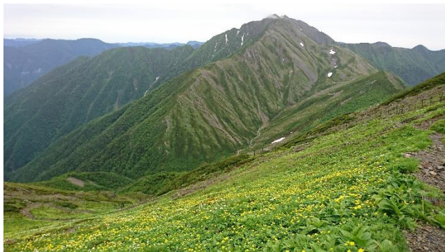
荒川岳の下り。何かが奇麗に咲いてました。