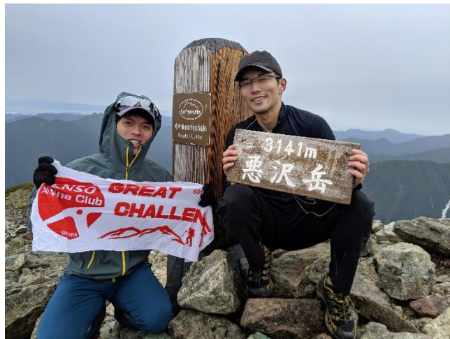
悪沢岳。まだ元気そう。