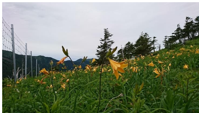
聖平にはニッコウキスゲも。