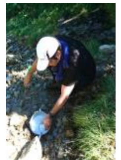
檜尾岳登頂 檜尾岳水場(チヨロチヨロ)