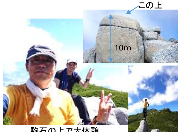
駒石の上で大休憩