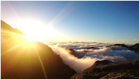
雲海とサンセット