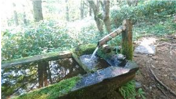
豊富な水量の水場