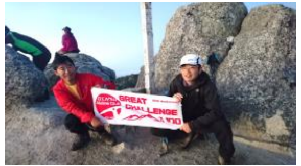
空木岳での登頂撮影